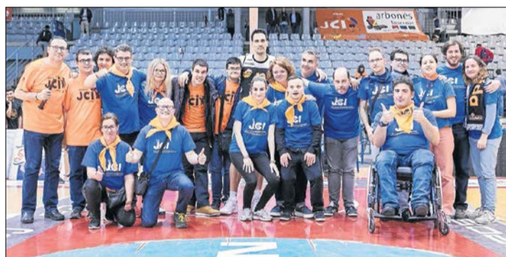
Moltes felicitats a la Colla Jove Cambra Internacional de Lleida per aquests 30 anys d'Aplec! Passeu-ho molt bé!