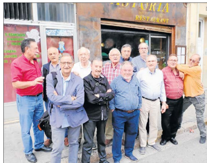
Velles glòries de la fotografia es van retrobar el dia 23 en un dinar.