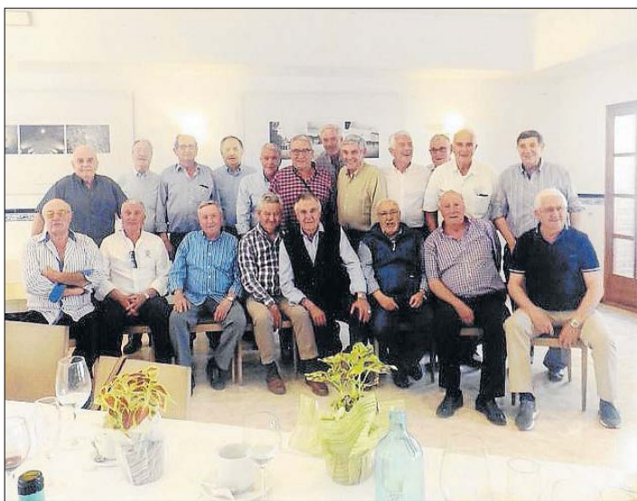
Els fundadors de la PM celebrarem la trobada anual al poble d'Aitona.