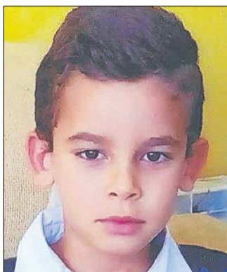
A aquest xicot tan guapo, que fa 7 anys, la família el felicita.