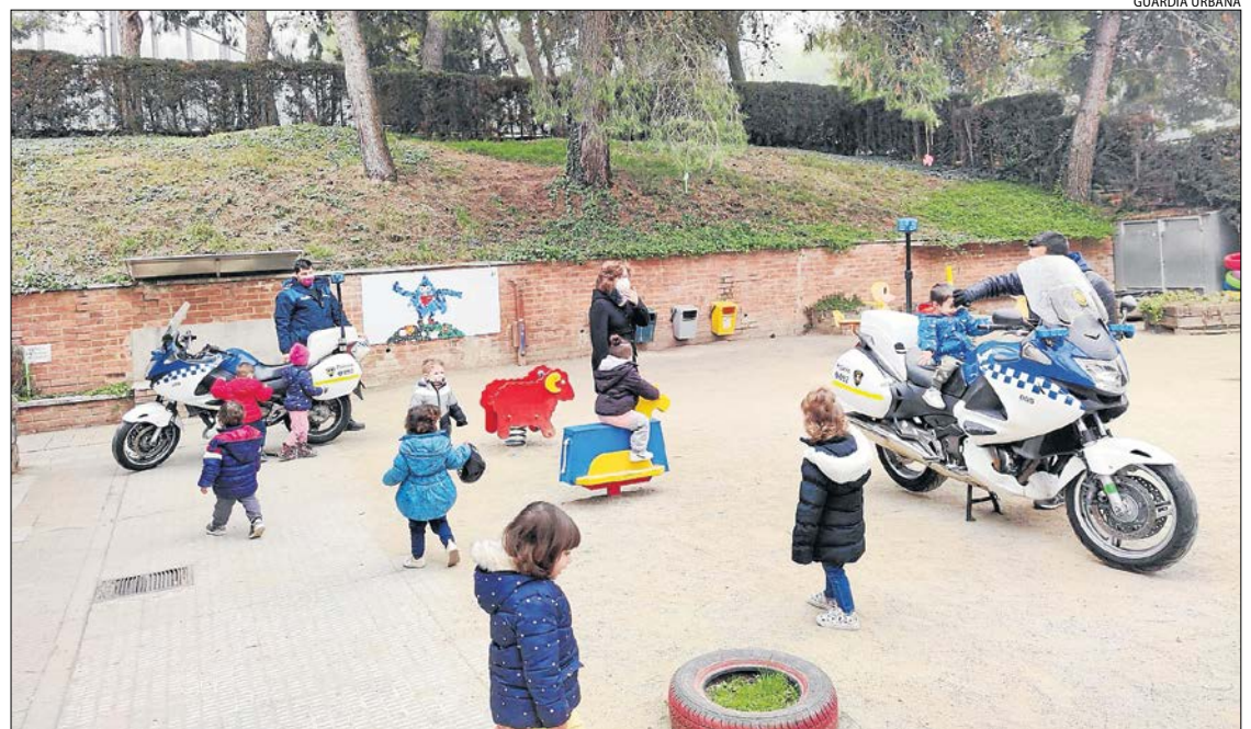
Els agents van ensenyar als nens i nenes de l'Escola Bressol La Faldeta alguns vehicles policials.