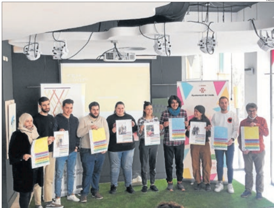
La presentació de la segona edició del programa 'Fem Coop!', ahir a LleidaJove La Palma.

Amb 30 places disponibles, el programa està dirigit a joves emprenedors d'entre 18 i 35 anys